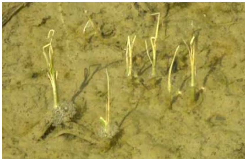
Impact conjugué de la salinité et du vent sur de jeunes plants de riz (photo du 20 mai)

Des dégâts importants ont été observés dans le sud de la Camargue au cours de la semaine passée, plus particulièrement sur des parcelles dans lesquelles les niveaux d'eau avaient été baissés pendant la période de Mistral des 15 et 16 mai.